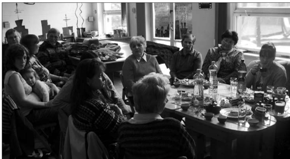
Ze setkání asistentů TS v dubnu 2010 v Letohradě