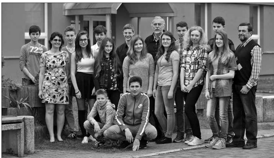
Paní učitelka (vlevo) s kolegy a žáky historického kroužku

Práci v historickém kroužku chápou jako příležitost, jak dětem přiblížit regionální dějiny. Žáci díky práci na projektech získávají vztah k místu, kde žijí, zajímají se o historii vlastní rodiny. Pokud děti budou znát příběhy svých předků, lépe