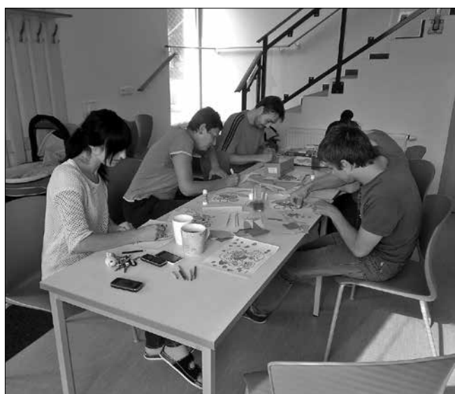
Klienti při prázdninovém tvoření

Je podle vás užitečné dávat lidem, kteří hospodaří s málem, materiální věci?